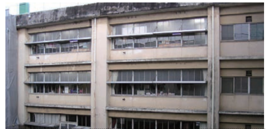
老朽化が激しい校舎