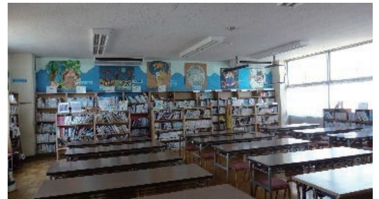
画一的な設計で作られた教室・図書室